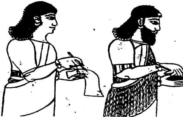
الرسم الجداري للكاتبين الآشوري والآرامي في تل بارسيب

وهكذا بدأ استخدام اللغة الآرامية في بلاد آشور فصار للحكام الآشوريين كتاب آراميون إلى جانب الكتبة الآشوريين، وهذا ما نجده على عدة آثار مرسومة من أصل آشوري، ومن هذه الرسوم الرسم الجداري الذي عثر عليه في قصر تل بارسيب والذي يعود لزمن الملك تجلات فلاسر الثالث حيث يظهر فيه كاتبان أحدهما يكتب على ورقة بردي أو قطعة من الجلد والآخر على رقيم طيني ، فالأول كان يكتب باللغة الآرامية والآخر يدون بالخط المسماري ٧ .