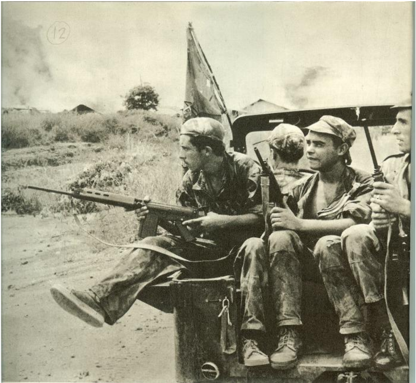
Soldati del Batt. Caçadores 280 (da "Angola 1961-1963")